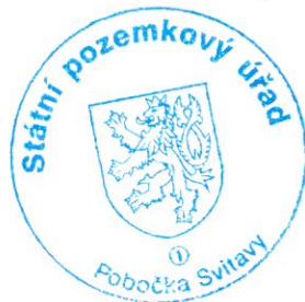
Ing. Miloš Šimek vedoucí Pobočky Svitavy Státní pozemkový úřad

Požadavek na ocenění dřevin rostoucích mimo lesní pozemek musí být uplatněn u pobočky nejpozději ve lhůtě do 16. srpna 2017 . Souhlas se zařazením pozemků dle §3 odst. 3 zákona do pozemkových úprav a jejich řešením ve smyslu § 2 zákona udělí vlastníci ve lhůtě do 16. srpna 2017 ; pokud se v této lhůtě nevyjádří, má se za to, že s řešením takových pozemků v pozemkových úpravách souhlasí.