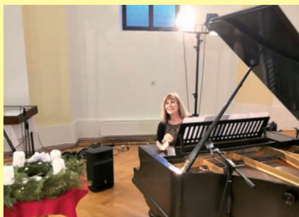
Adventní koncert ZUŠ Jevíčko si můžete stále prohlédnout na You Tube