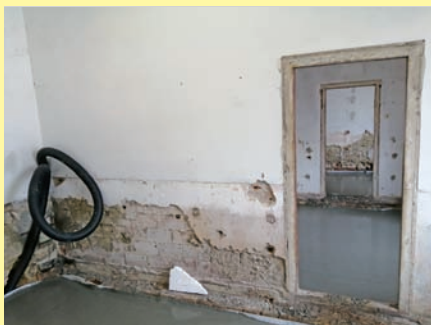
Zkraje roku jsme zahájili havarijní opravu kluboven v Panském dvoře