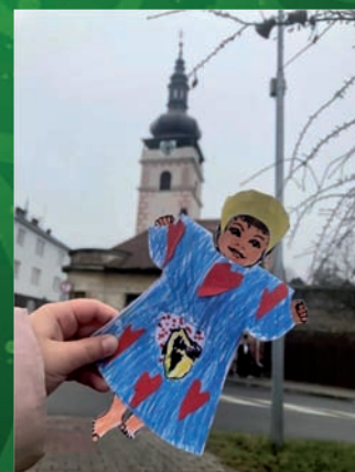
3. Místo Zuzana Řehořová 5 let MŠ Jevíčko - kapříci