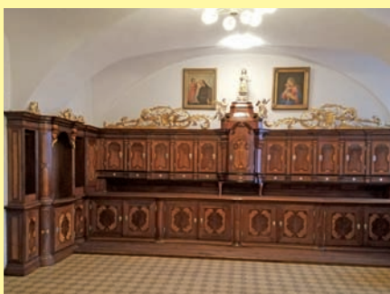
Barokní mobiliář jsme nominovali na památku roku, více uvnitř zpravodaje