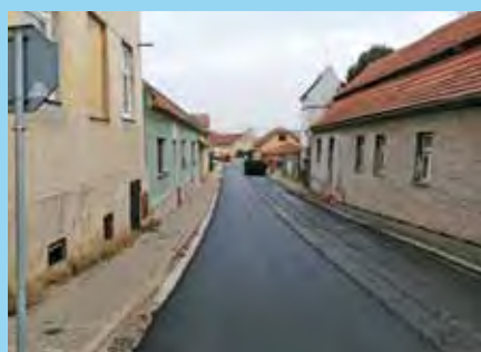
SÚS Pk opravila ve městě rozsáhlé úseky komunikací