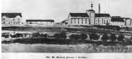
Ok. 20. Akční pivovar v Jevíčku.

„Pivo na váhu. Jak se z Vídně oznamuje, dějí se v ministerstvu financí pokusy, aby na příště pivo se vážilo místo měřilo. K účelu tomu bude prý zřízen zvláštní přístroj, který současně pšobí tak, že daň vypočtena bude nikoli z hektolitrů nýbrž ze 100 kg váhy a mimo to dle dosavadního způsobu stupňového obsahu“ (na fotografii jevíčský pivovar zal. 1898). A ještě něco praktického. Je řeč o vodovodu – konečně dala židovská obec souhlas s jeho vybudováním v ulici Židovské (nyní Soudní). A přání redaktora?: „Tak snad bude ona ulice čistější“.