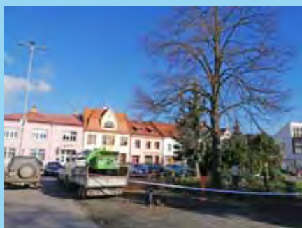
Probíhá bezpečnostní údržba dřevin ve městě