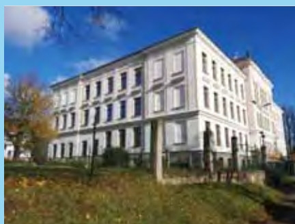
Na budově gymnázia se dokončuje nová fasáda