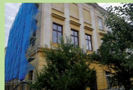
Na gymnáziu se začala osazovat nová dřevěná okna