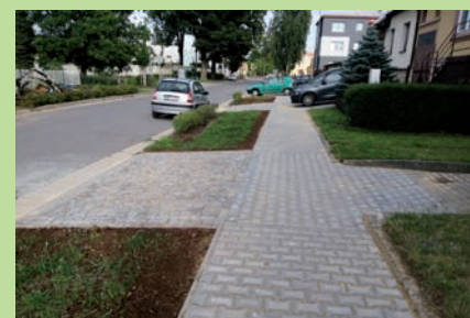
Nově zdlážděný chodník na Svitavské po přeložce knn