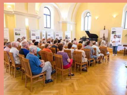
Vernisáž výstavy Architektura ve službách 1. republiky