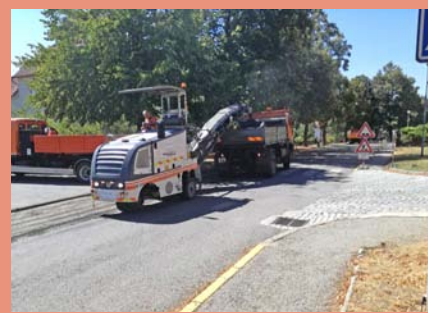
Opravy komunikací ve městě v režii SÚS