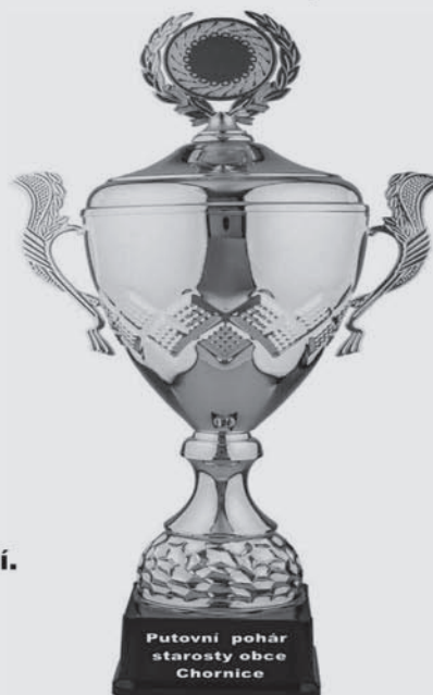
Putovní pohár starosty obce Chornice

Jedná se o soutěž s požární stříkačkou ps-8 bez úprav.