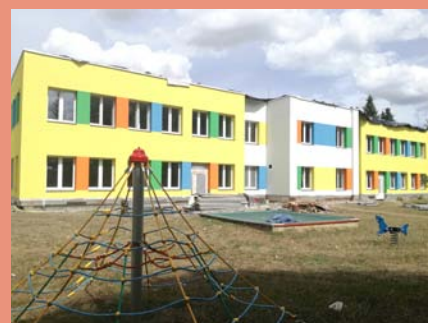
Budova školky se rozsvítí veselými barvami