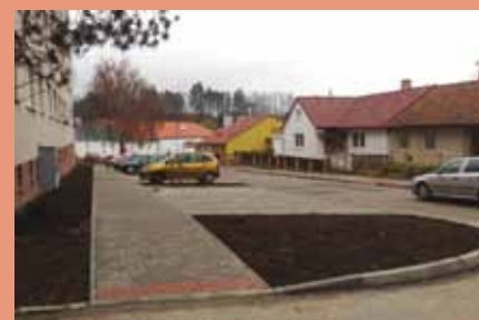
Nové parkoviště slouží obyvatelům sídliště M. Mikuláše