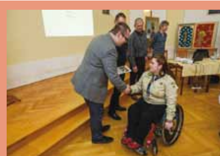
Na setkání se zástupci spolků byla předána výroční ocenění města 2017