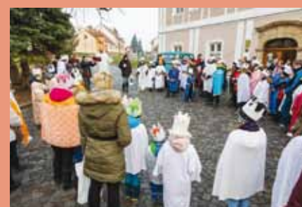
Tříkrálová sbírka byla i letos úspěšná