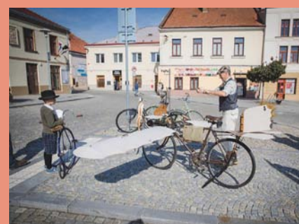
Jevíčkem se prohнали velocipedisté z Biskupic