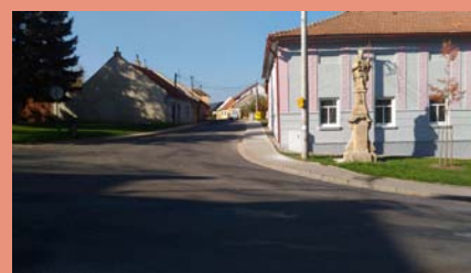
Nový chodník spojuje ul. Okružní I a Třebovskou