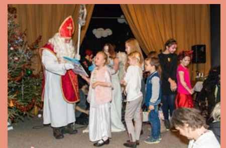
Druhou adventní neděli obdaroval děti v sále hotelu Morava sv. Mikuláš