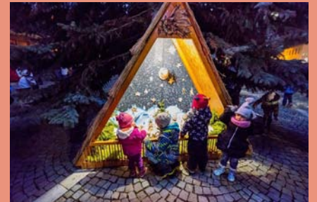
Na náměstí se 3. prosince rozsvítil vánoční strom s keramickým betlémem