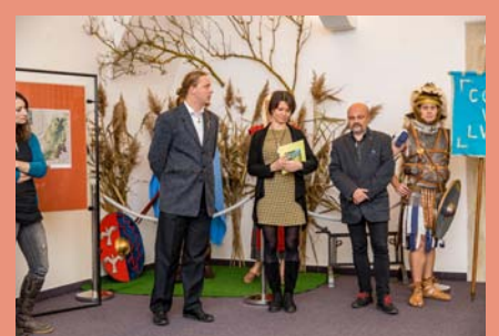
7. prosince proběhla vernisáž archeologické výstavy „Barbaři v pohybu“