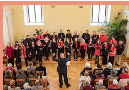
V synagoze proběhl úspěšně osmý ročník přehlídky pěveckých sborů Okolo Jevíčka