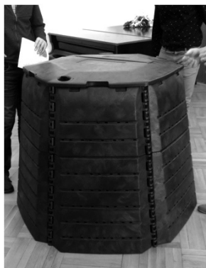
Zvolený typ kompostéru