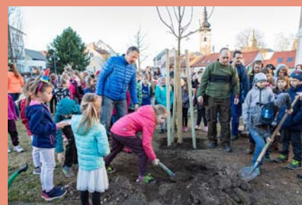
V rámci Noci s Andersenem byl 6. 4. zasazen u základní školy nový jírovec