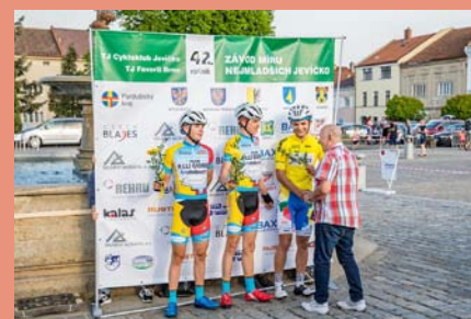
42. ročník Závodu míru nejmladších ve dnech 4. - 6. 5. 2018 vyhrál italský tým Giorgio