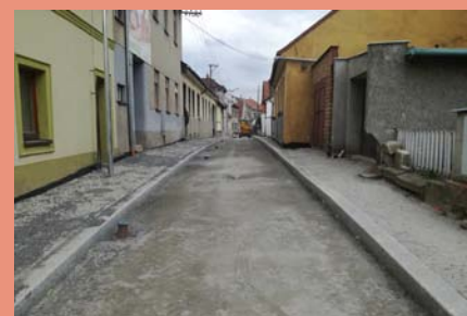
Ulice Růžová získává finální obrysy, dokončení je v plánu do 30. 6. 2018