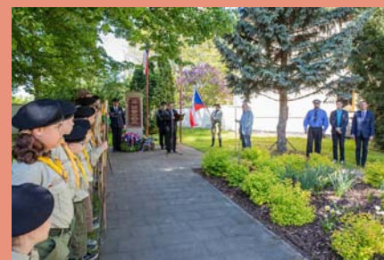
Připomněli jsme si 73. výročí konce 2. světové války za doprovodu jevíčských skautů a hasičů