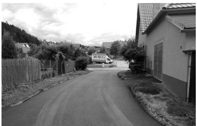
opravená část místní komunikace od čp. 3 po čp. 2