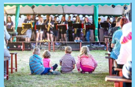
Veleúspěšný Etien Band to rozbil v rámci Mejdanu na Zámečku