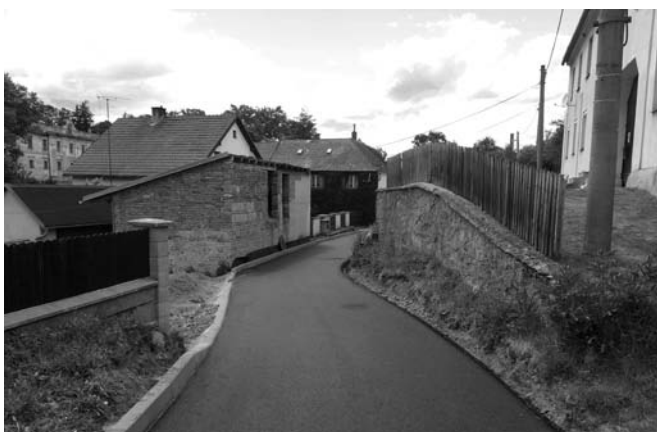
opravená část místní komunikace od čp. 3 po čp. 2