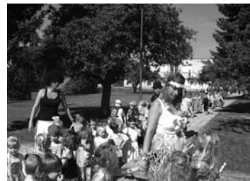
Maškarní průvod městem na zmrzlinu