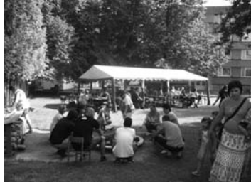
Rozloučení se školním rokem