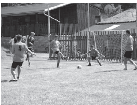
pouťový fotbalček 2017