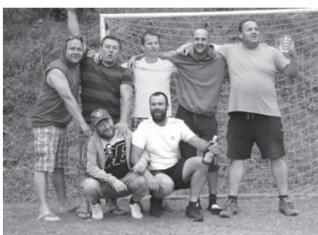
pouťový fotbalček 2017