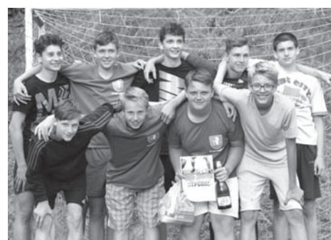
pouťový fotbalček 2017