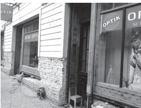
Restaurování výkladců domu Třebovská 71