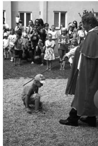
Pasování na školáky