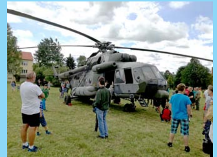
Na konci června přistál k radosti všech dětí na sídlišti vrtulník