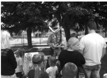
Rozloučení se školním rokem