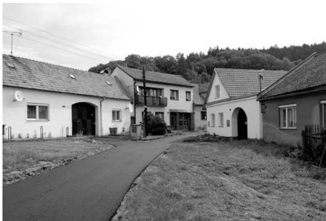
opravená část místní komunikace od čp. 3 po čp. 2