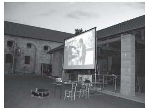
první letní kino v technickém areálu obce