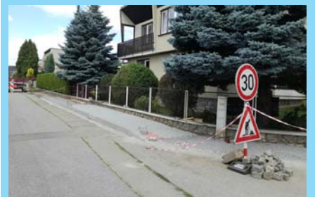
Pracovníci města pokračují v další etapě chodníků na Slunečné