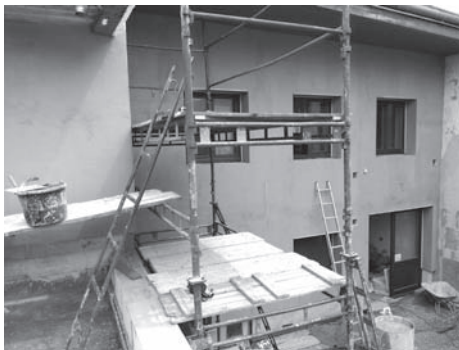
Zateplování budovy MěÚ Jevíčko