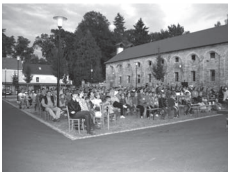
první letní kino v technickém areálu obce

Informujte se nejlépe do 31. srpna na tel. čísle 776 583 015 nebo emailem: ms.biskupice@seznam.cz