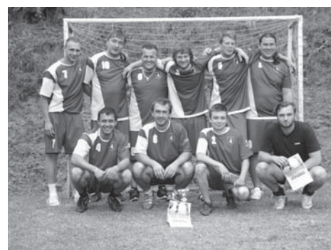
pouťový fotbalček 2017