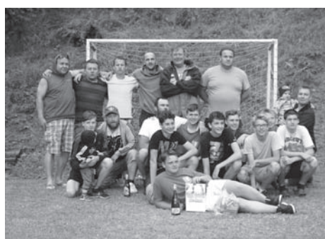
pouťový fotbalček 2017