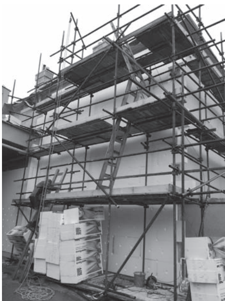
Zateplování domu Křivánkova 98