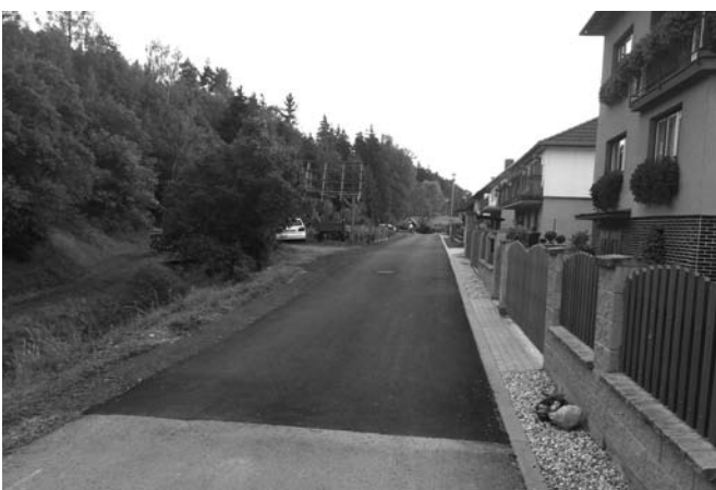
opravená část místní komunikace od čp. 128 po čp. 150

probíhá oprava střechy v technickém areálu obce na budově bývalé běčárny