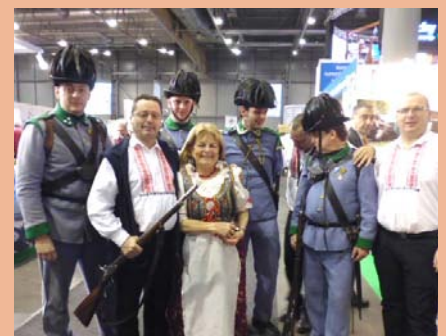
Veletrh cestovního ruchu REGIONTOUR Brno