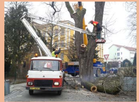
Proběhlo kácení problémového jírovce na A. K. Vitáka