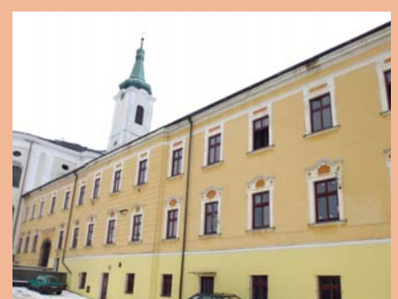
Z dotace MK jsme vyměnili okna na bývalém klášteře

Vážení podnikatelé a zástupci jevíčských firem a podniků, zveme Vás na