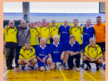
Jubilejní 30. ročník turnaje v halové kopané Jevíčko-Cup - zápas legend