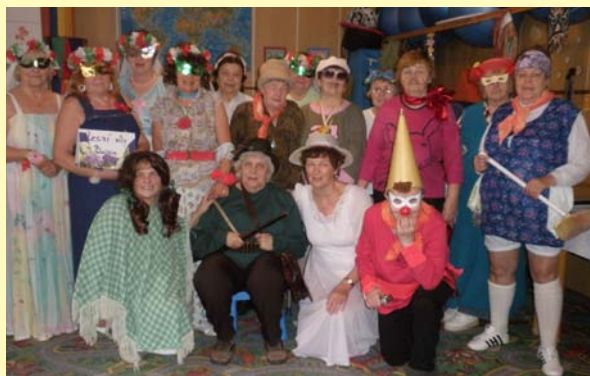
Šibřinky senior klub RC Palouček

Činnost centra je financovaná z prostředků Pardubického kraje a města Jevíčka.