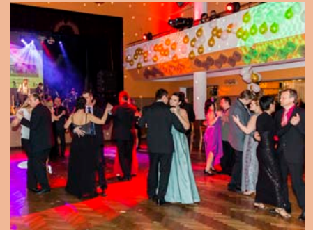
5. 2. 2016 proběhl X. Městský ples