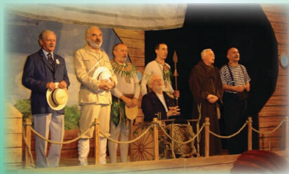
Příjemný kulturní zážitek přejí pořadatelé.

PŘEDSTAVENÍ SE USKUTEČNÍ ZA PODPORY MĚSTA JEVÍČKA