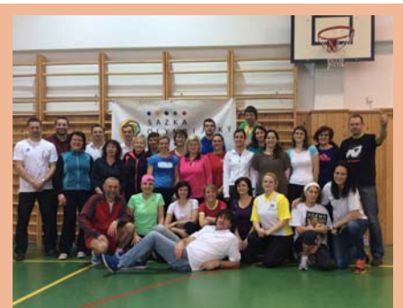
Naši školu navštívila mistryně světa v trojskoku Šárka Kašpárková