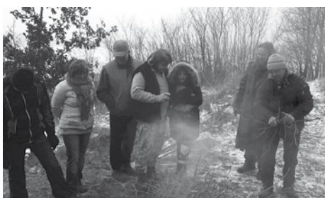
Silvestrovské věšlap na Hrubé kolo