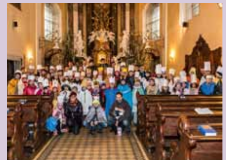
Tříkrálová sbírka, 10.1.2015