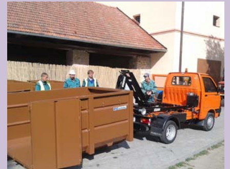
Naši pracovníci mají nového pomocníka