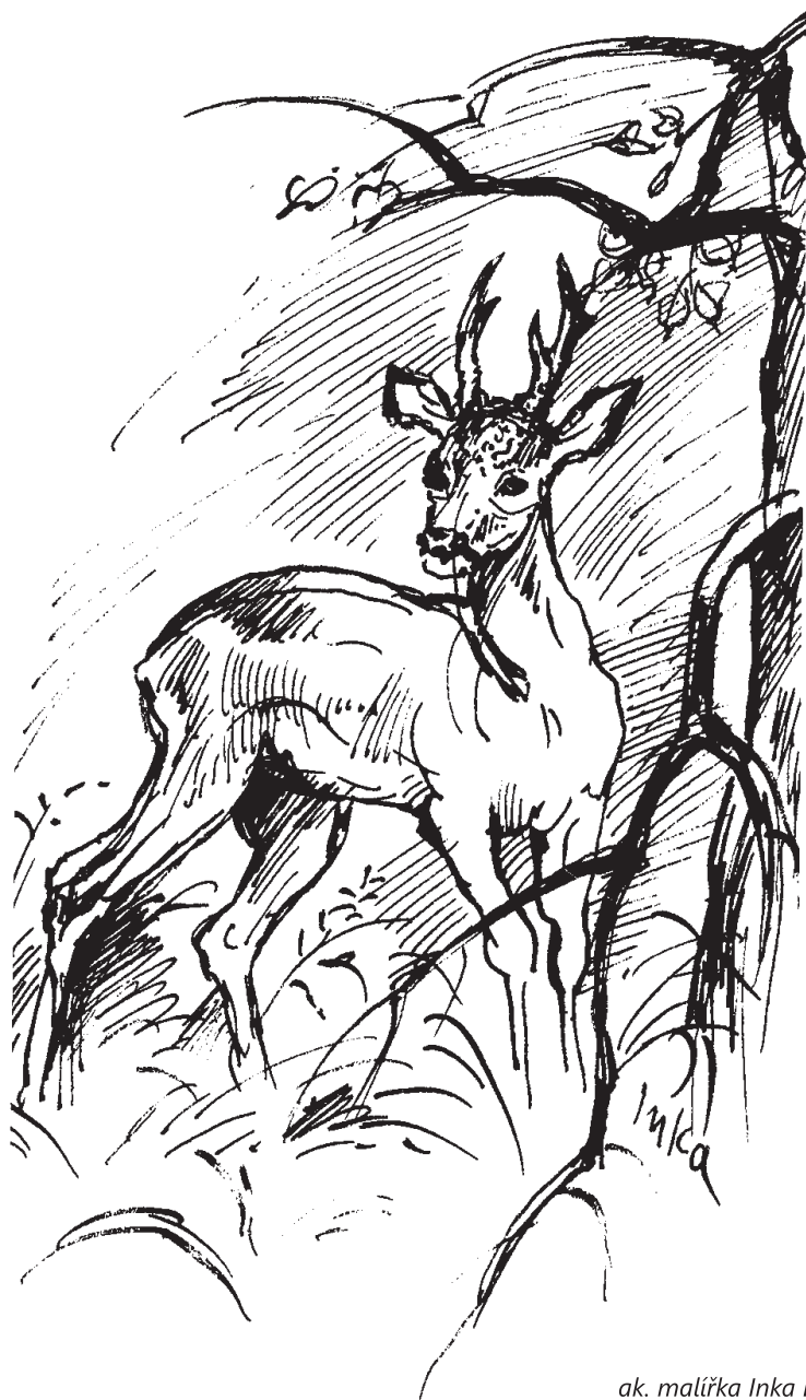
ak. malířka Inka Delevová