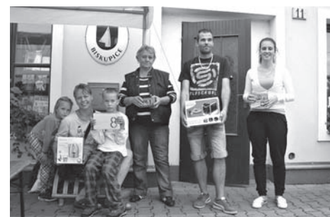
Vítězové v soutěži ASEKOL ve sběru elektrozařízení