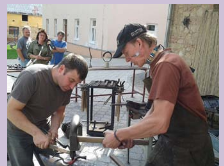
Práce uměleckých kovářů v rámci Dnů evropského dědictví