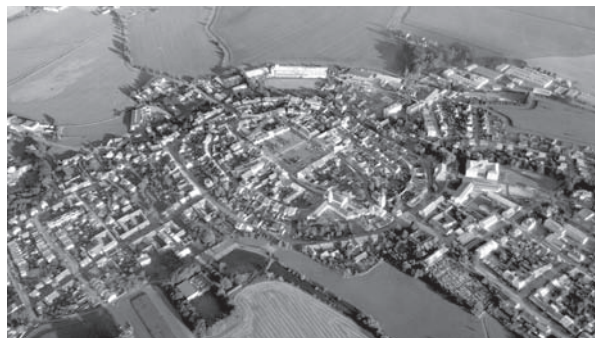
Jevíčko, srpen 2015