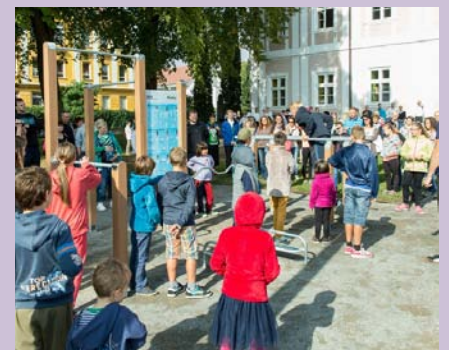
Protáhněte si tělo u zámečku