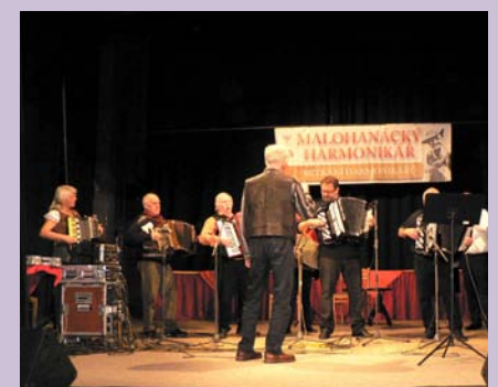
17. října úspěšně proběhl 7. ročník „Malohanáckého harmonikáře“, sál hotelu Morava Jevíčko