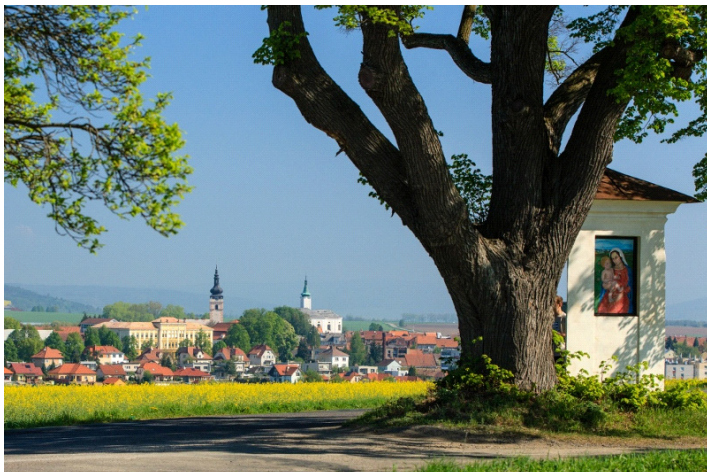
Vítězná fotografie soutěže Kalendář 2016 Města Jevíčka, autor Ing. Roman Christ

Soutěžní fotografie budou vystaveny ve vestibulu Gymnázia Jevíčko od 2. do 6. listopadu 2015 v době 8:00 – 17:00 hodin.