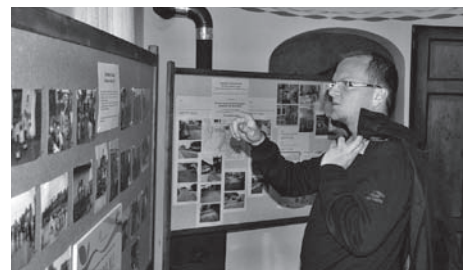
Pan hejtmán na výstavě u Valouchů