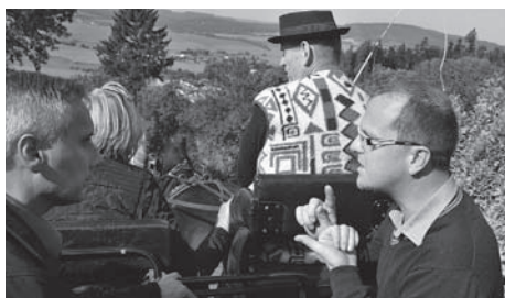
Projížďka hejtmána po krásách obce spojená s jednáním o obci