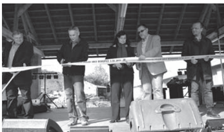
Přestřižení pásky Biskupického zázemí obce

Fotogalerii k akci je možno zhlédnout na www.biskupice.cz .