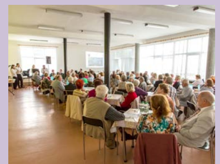
Beseda představitelů města s důchodci