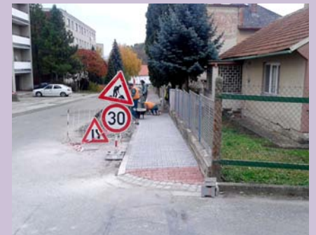
Pokračujeme v další etapě budování chodníků, tentokrát na M. Mikuláše