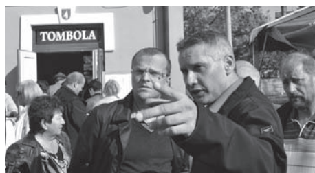
Prohlídka nového areálu