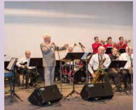
Koncert Jevíčského Big bandu a RH big bandu