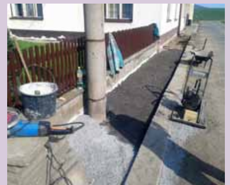
Pokračujeme v překládání chodníků