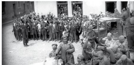
Príslušníci Rudé armády v Jevíčku

S úctou vzpomínáme na spoluobčany, kteří se toužebně očekávaného míru nedožili a zahynuli v boji s německým fašismem právě na samém prahu svobody v roce 1945. Ačkoliv jsou jejich životní osudy rozdílné, jedno mají společné. Milovali svoji vlast tak, že pro ni obětovali i svůj život.