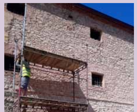
Sýpka bude mít nový kabát