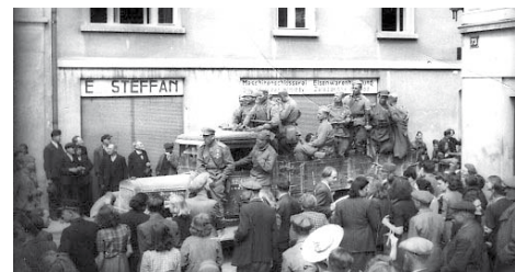
Príslušníci Rudé armády v Jevíčku