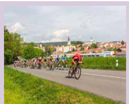
Jevíčkem se prohnal 39. ročník GP Matoušek, Závod míru nejmladších cyklistů Evropy