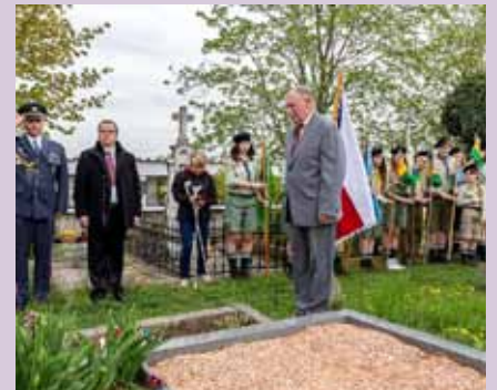
Uctili jsme památku obětí 2. světové války pietním aktem k 70. výročí osvobození