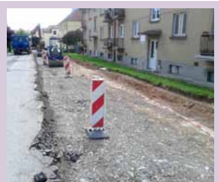
Oprava komunikace Nerudova zahájena