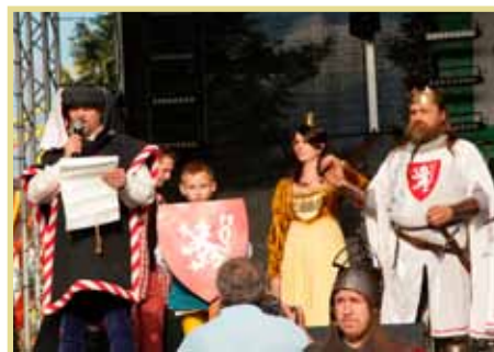
Přemysl Otakar II.