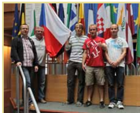
Návštěva Evropského parlamentu