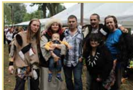
Vítězové ve vaření guláše