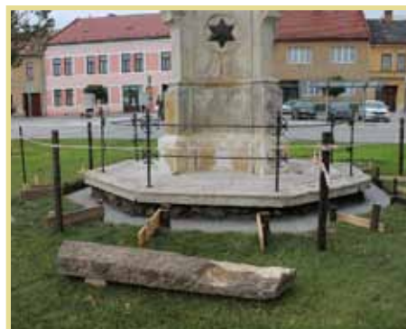
Oprava sousoší sv. Jana Nepomuckého