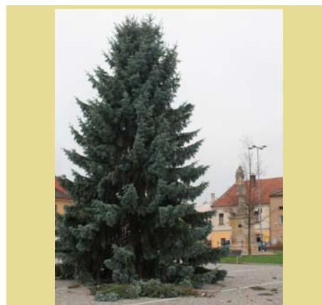
Na náměstí v Jevíčku dorazil vánoční strom