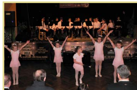
11. Festival mládežnických dechových orchestrů v Jevíčku