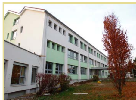
Finální podoba ZŠ Jevíčko po revitalizaci