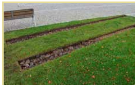
Rozježděný trávník na Palackého nám.