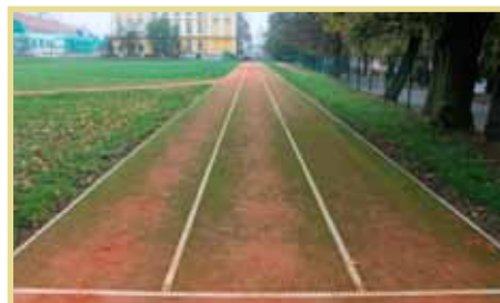
Atletická dráha nám pěkně zarůstá