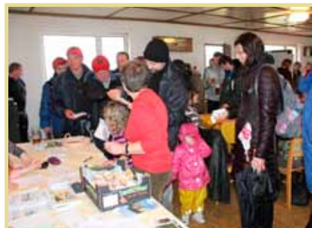
Pochod Jarní Přírodou