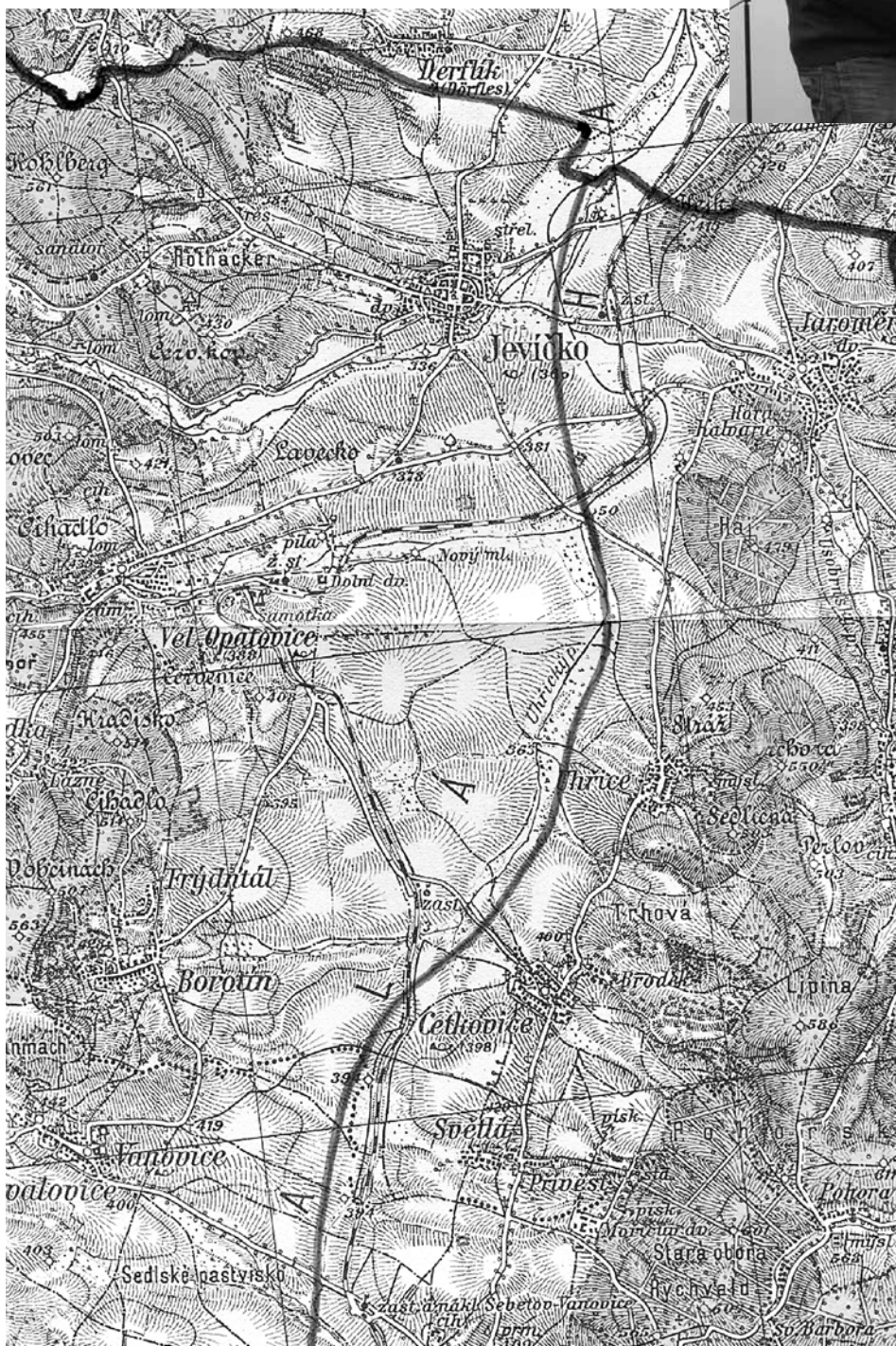
První varianta trasy dálnice prosinec 1938

Vzhledem k obstrukcím ekologických aktivistů to bude trvat velmi, velmi dlouho. Od