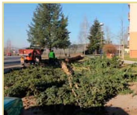
Kácení na sídlišti Karla Čapka