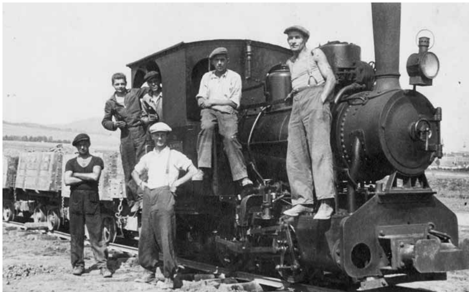
Parní lokomotiva Borsig (upravo od lokomotivy je vidět Jevíčko)