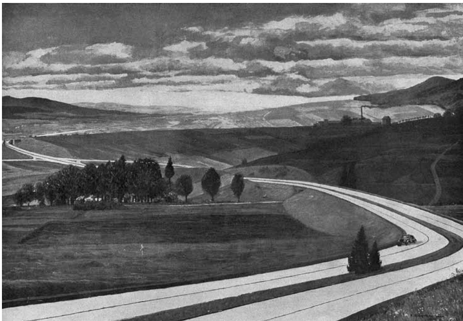
Vizualizace dokončené dálnice u Jevíčka a Velkých Opatovic

těji do Brna než do Pardubic. Jezdíme tedy okolo Černé Hory. Zde opět ukázka neznalosti nebo snad lajdáckosti ekologických aktivistů a potažmo snad i krajských úředníků z Brna. Z pohledu definitivního určení trasy dálnice trvá příprava úseku mezi Černou Horou a Kuřimí nejdéle. Původně chtějí trasě vést dálnici podél dnešní komunikace I/43. Je to však špatné řešení. Dnes již mnoho pamětníků není. Avšak mezi lety 1995 a 2000 kdy jsem se touto problematikou začal zabývat jich bylo mnoho. Čas je neúprosný. Nechám proto promluvit jejich vzpomínky, které jsem zaznamenal. Zde východně od Malhostovic byla trasa dálnice vytyčena kovovými sloupky. Tak začíná vyprávění jednoho z pamětníků. A mohu pokračovat kousek vedle. V Nuzlířově, Lipůvce, Závisti, Milonicích nebo Malé Lhotě. Nebo také ve Znojmě, kam se jeden z pamětníků po válce přestěhoval.