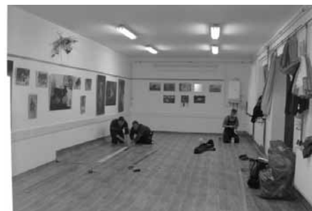
ními možnostmi obce. Jménem všech uživatelů tímto zastupitelstvu vyslovuji poděkování.

Knihovna nabyla k vylepšení technického zázemí kopírku a laminátor i na formát A3, nainstalovala se barevná tiskárna, darovaná firmou S-Cart, je zde zřízeno připojení wi-fi, veřejné počítače pracují spolehlivěji. To vše patří ke standardnímu vybavení knihovny a Jaroměřice tak mohou všechny tyto služby čtenářům a hostům obce poskytnout. Nic není samozřejmé - vše musí být v souladu s finanč-