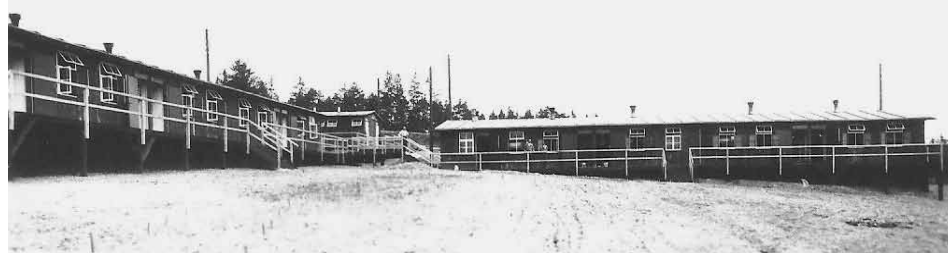
Pohlednice zachycující dělnický ubytovací tábor u Jevíčka (Reichsautobahnlager Soest)

- Wansse. Této firmě jsem nevědomky přisoudil stavbu celé dálnice od Městečka Trnávky až po Vanovice a to včetně mostních objektů. Stavební firma Hermann Milke však stavěla pouze úsek dálnice od protektorátní hranice směrem k Jevíčku a dále k obci Vanovice. Dle zadávací dokumentace prováděla veškeré zemní práce, stavbu menších propustků, kanalizace a měla provést pokládku betonových vozovek. Betonové vozovky měly být položeny na celém úseku dálnice v okolí Jevíčka. Mostní objekty byly zadávány samostatně jiným stavebním firmám. Podrobnosti ke stavbě těchto objektů naleznete v tabulce.