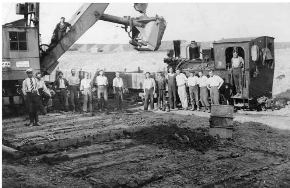
Motorové rypadlo Demag a parní lokomotiva Henschel na stavbě dálnice u Jevíčka