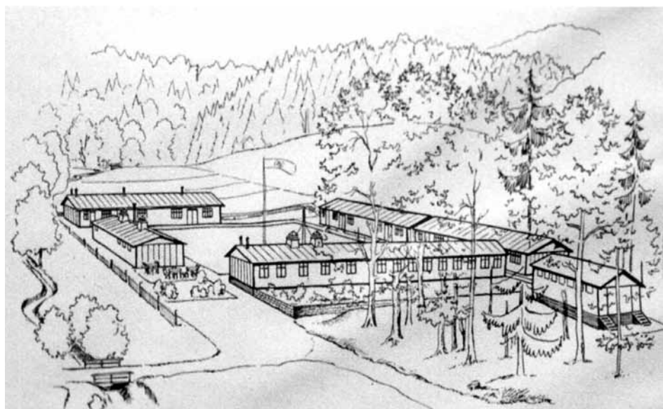
Kresba dělnického ubytovacího tábora nedaleko Visky u Jevíčka