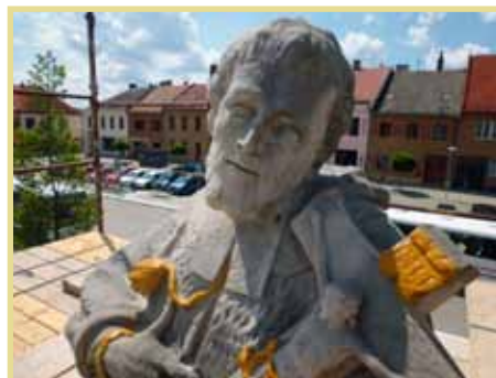
Restaurování sochy sv. Jana Nepomuckého