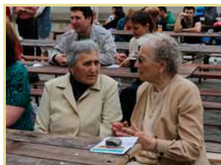
Gymfest byl nejen pro studenty