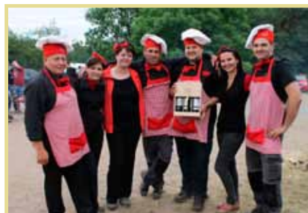
Jevíčtí Frakaři bodovali s gulášem na Křetínce