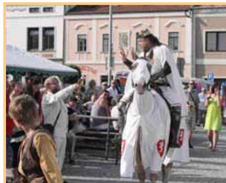
Příjezd Přemysla Otakara II.