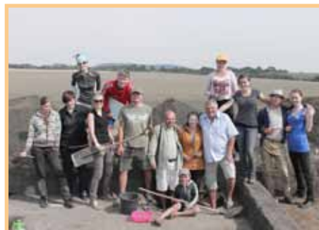
Archeologický výzkum pokračuje