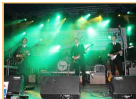
Beatles revival na pouti