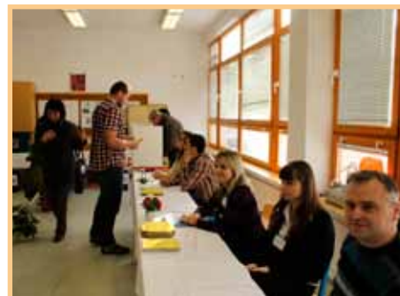
Prezidentské volby první kolo