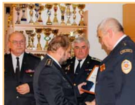
Valná hromada SDH Jevíčko