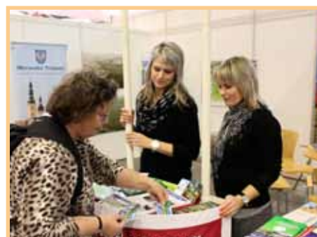
Jevíčko na veletrhu Regiontour