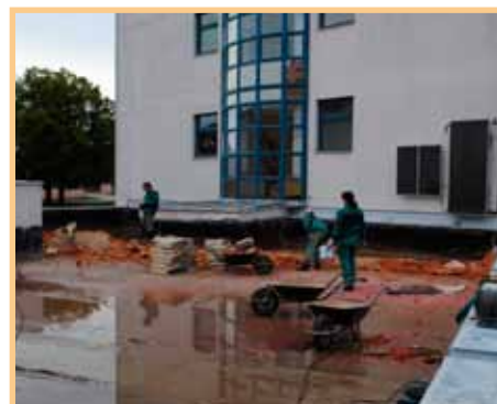
Začala rekonstrukce střechy na ZŠ