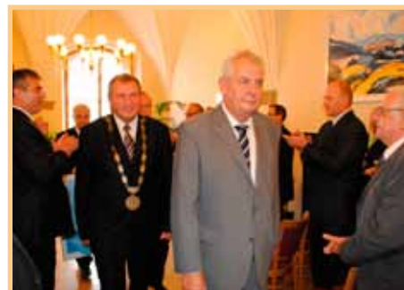
President republiky v Moravské Třebové