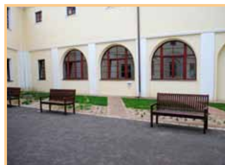
V atriu kláštera se finišuje