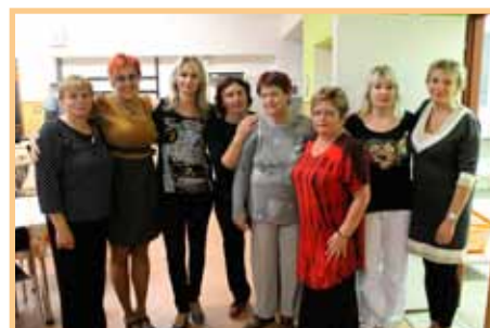
SPOZ uspořádal besedu s důchodci