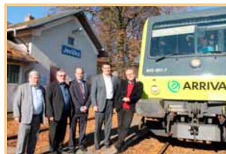
Jevíčskou stanicí projel osobní vlak