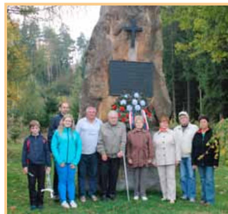
Pietní akt u napoleonského pomníku