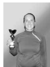
Vítězka Memoriálu a ligy

Za pořadatele a TJ SK Jevíčko Medvěď a Kopřiva