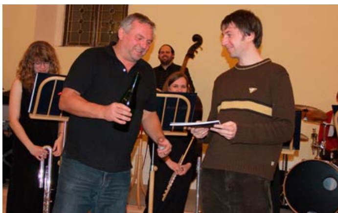
Koncert Black Ladies a přivítání nové knihy