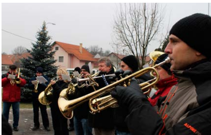
Tradiční koledování s Malohanačkou