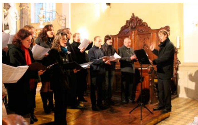
Adventní koncert ZUŠ Jevíčko