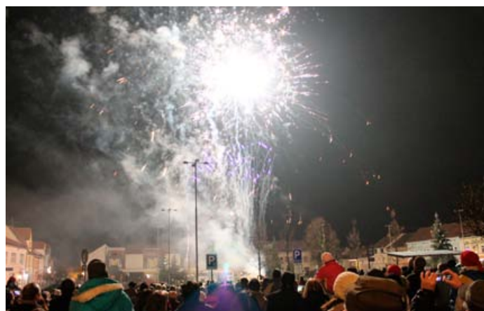
Novoroční přípítek s ohňostrojem