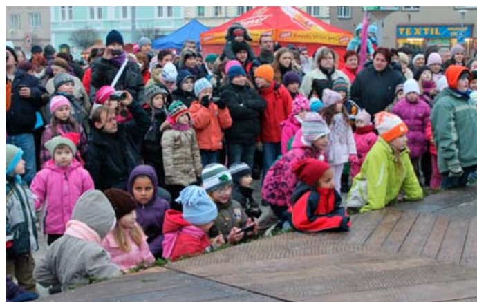
První vánoční jarmark s živým betlémem