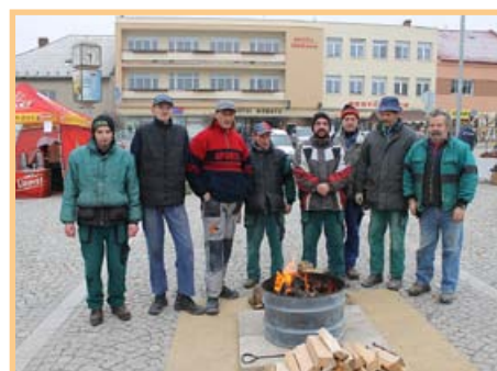
Vánoční jarmark – zima je prevít