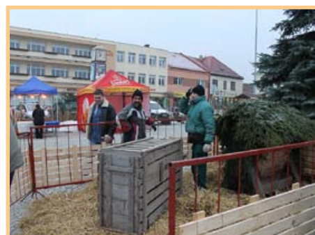
Vánoční jarmark – příjezd ovcí