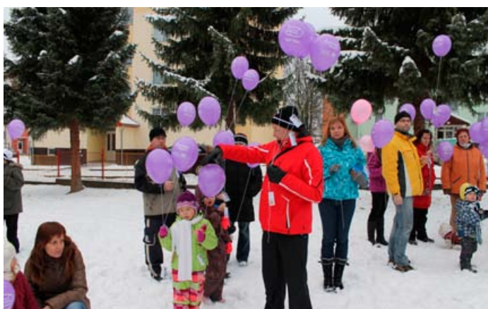
Vypouštění balónek s přáním Ježíškovi