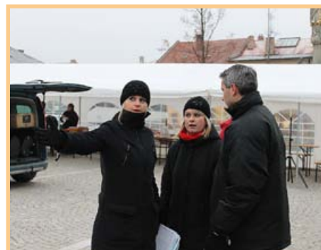
Vánoční jarmark – koordinační porada