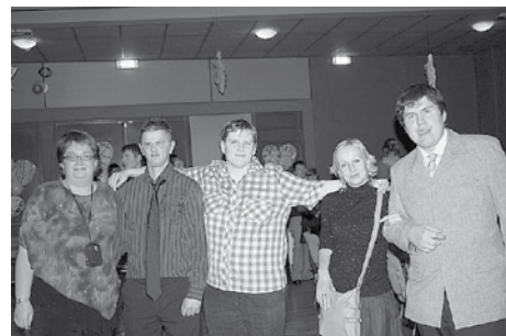
Foto z Valentýnského plesu

Pokojné prožití postní doby přeje tým pracovníků Oblastní charity Moravská Třebová. Více informací na www.mtrebova.charita.cz