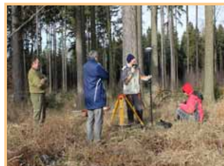
Nalezení vrcholu Kumperku