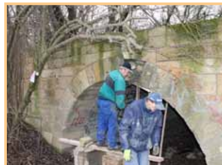
Oprava prasklého mostu na R43