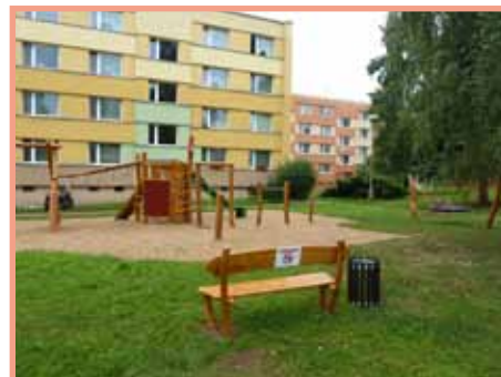
Dětské hřiště na sídlišti