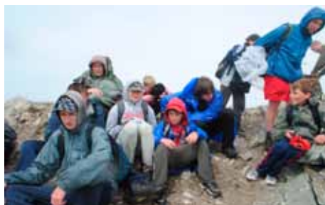
Fotografie z letního tábora v Bobrovecké dolině