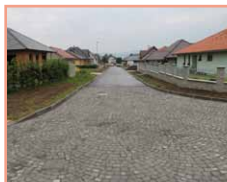
Mackerleho ulice s novou komunikací