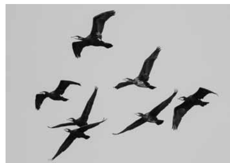
Část skupiny kormoránů nad biskupským mlýnem, 28. 1. 2012

Takže je důvod k obavám? Já myslím, že nikoliv. Jak z textu vyplývá, problémem nejsou „domorodí“ osadníci, ale skupiny migrujících ptáků. A naše klimatické podmínky spolu s charakterem umístění vodního díla způsobí poměrně brzký zámraz i tím i uzavření potravinového okna. A není-li toto schopno kormorány uživit, nezůstanou zde. Prozatím ale máme, pro nás výjimečnou možnost, pozorovat výskyt jednoho jedince při procházkách kolem biocentra, pakliže se tam ještě v době, kdy čtete tento článek kormorán stále vyskytuje.