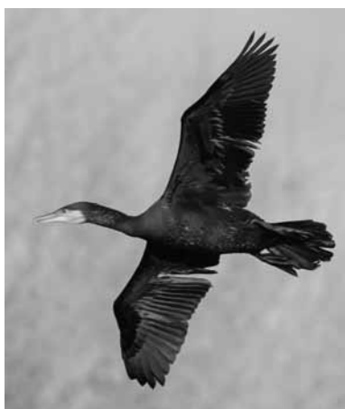
Let nad biocentrem 17. 4. 2012

Kormorán velký je v současné době jedním z nejkontroverznějších ptačích druhů u nás. Je chráněn