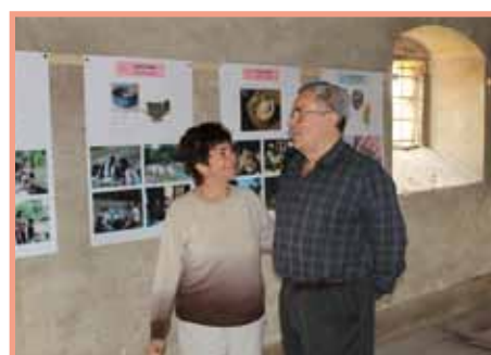
Nová expozice germánů na sýpce