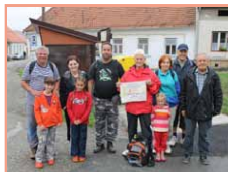
Pochod po tělese R 43