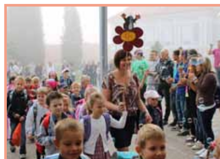
Prvnáci jdou do školy