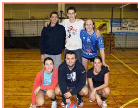
Vítězové volejbalového turnaje Srstka Open-USA Brno