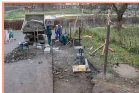
Nové zábradlí do Žlíbek