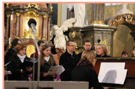
III. Advent – koncert v kostele