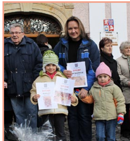
IV. Advent – vánoční mls