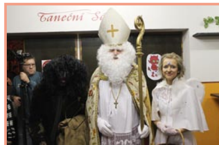
II. Advent – mikulášský karneval