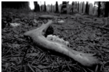
Daniel Cigánek / vítězná fotografie „Lesní hřbitov“

své díla vystavovali, nebo alespoň je poslali do soutěží. Nadaní studenti Gymnázia z Jevíčka své fotografie poslali do soutěže