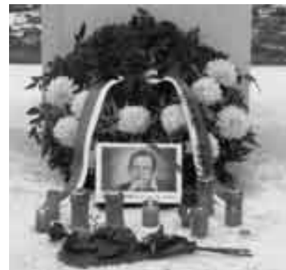
Dne 23. 12. 2011 jsme tichou vzpomínkou uctili památku zesnulého Václava Havla, prvního prezidenta České republiky.

26. ledna 2012 23. února 2012 29. března 2012 26. dubna 2012 24. května 2012 28. června 2012 30. srpna 2012 27. září 2012 25. října 2012 29. listopadu 2012 V měsíci červenci se nejedná.