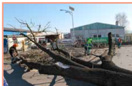
Ve městě probíhalo kácení