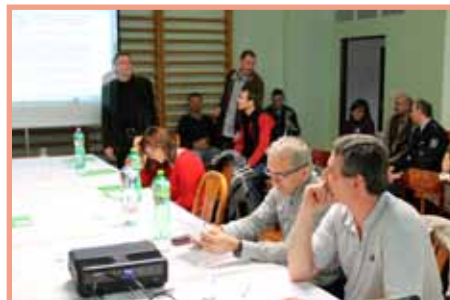
Zasedání ZM v sokolovně ve Žlíbkách