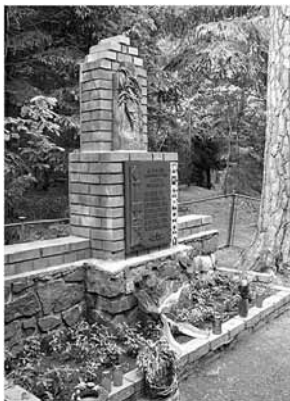
Pomník zahynulým letcům u Jevička

Ze zprávy č. 800 ze dne 27. 5. 1949 vyplývá, že MNO bylo ve 03.00 hod informováno, že jsou pohřešovány dva letouny, které buď havarovaly, nebo nouzově přistály. I přesto, že bylo konstatováno, že se nejedná o ilegální odlet letadel, byly informovány příslušné útvary (KV STB, pohranič-