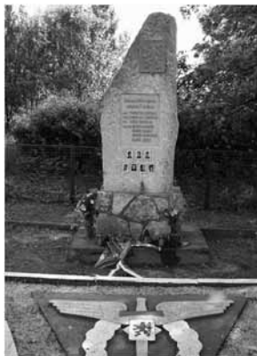
Pomník zahynulým letcům u Jaroměřic