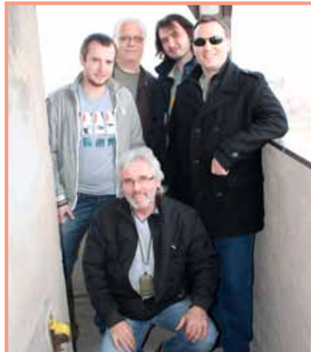
Skupina Poutníci na městské věži