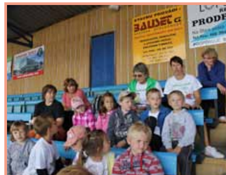
MŠ na soutěži v Pardubicích