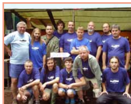
Stanmont odjel do Bobrovice