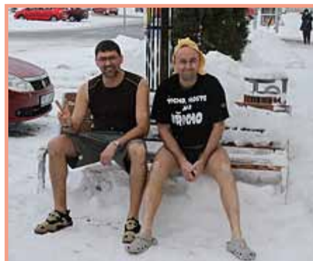
Město přikryla sněhová peřina