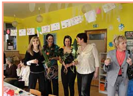
MŠ oslavila 30. narozeniny