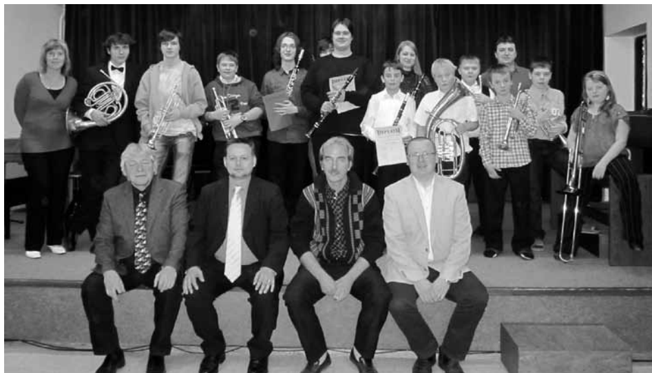
Okresní kolo, 6. 2. 2012, ZUŠ Svitavy, soutěžící a pedagogové ZUŠ Jevičko a odborná porota