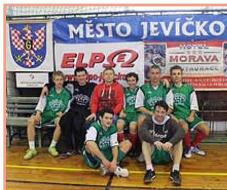
FC Žlíbka vítěz „Sálovky 2012“