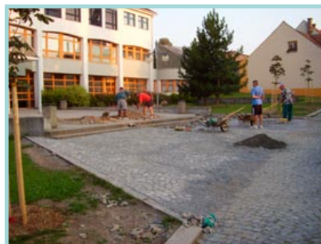
Nový chodník u ZŠ