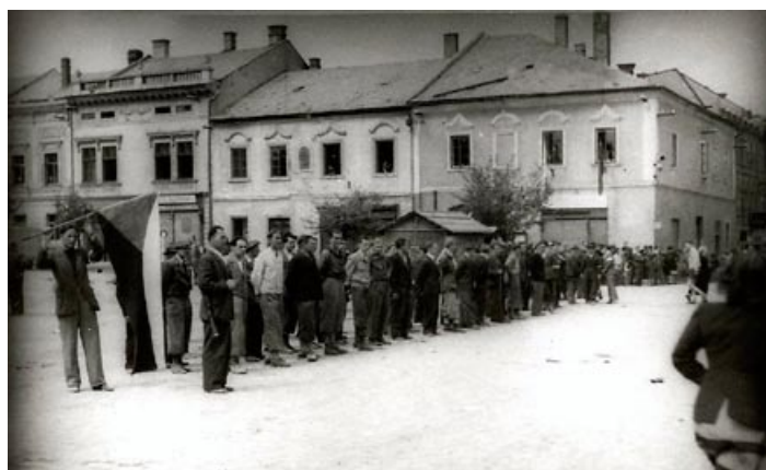
Osvobození v roce 1945