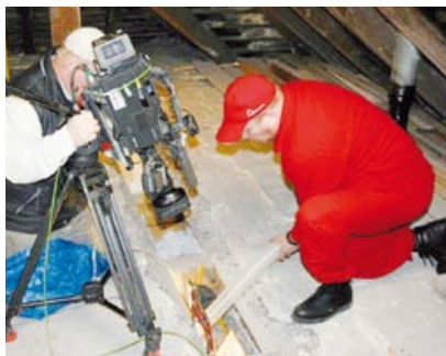
Při natáčení pořadu Rady ptáka Loskutáka - zateplení dutiny trámového stropu

Pokud by existoval způsob, jak ušetřit 30% za topení, tak by ho jistě každý majitel domu rád znal. Dobrá zpráva je, že to jde. Řešení je již na světě a opravdu to funguje. Přesvědčili se o tom majitelé již více než 12 tisíc objektů u nás. Když si představíme dům, kde za topení vydáváme kolem 35 tisíc ročně, tak dokážeme každý rok ušetřit až 10 tisíc korun.