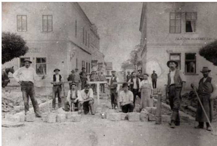
První základy náměstí