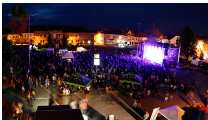
Oficiální otevření náměstí 14. 8. 2011 se skupinou NO NAME