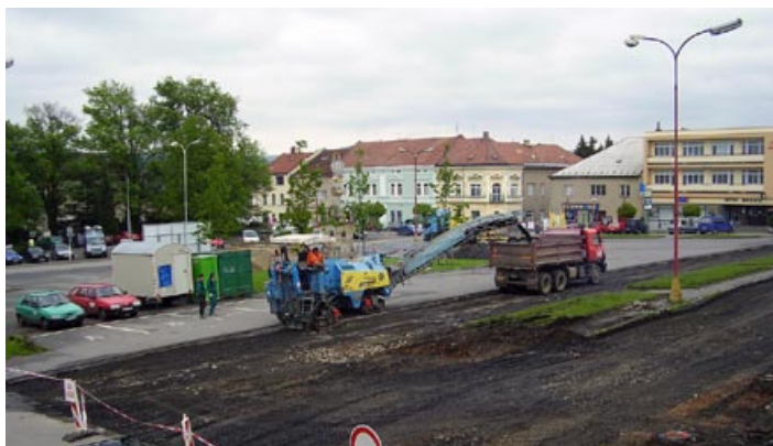
První zásah do povrchu náměstí duben 2010