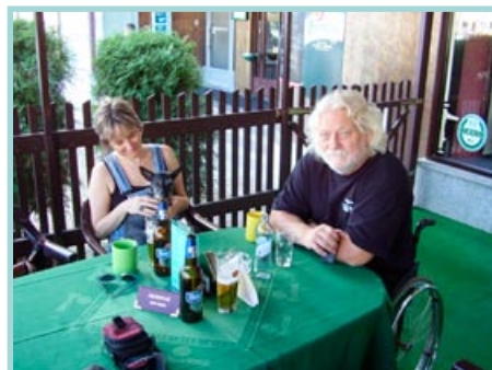
ŽDJC – bude v Jevíčku 3. 10. 2011