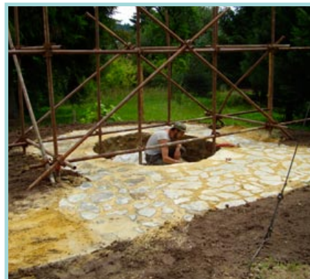
Pracujeme na rumpálové studni