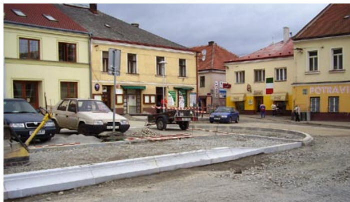
Vznikající autobusové nádraží