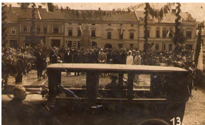
Návštěva T. G. Masaryka v roce 1929