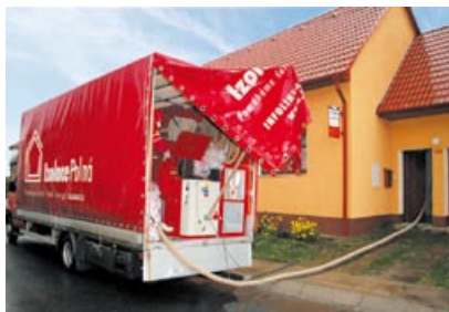
Foukání izolace hadicí z vozu před domem

Představte si, že sedíte pohodlně v obýváku, koukáte oblíbený film a než skončí, máte hotovo. Stačí 3 hodiny a šetříte také. Bez námahy, bez nepořádku a v super kvalitě. Nehádáte se s řemeslníky, nestavíte lešení, neuklízíte nepořádek. Je to možné? Ano. Když si vyberete zkušené machry, kteří službu zdokonalují mnoho let. Ti mají cenné zkušenosti a chtějí klientovi upřímně pomoci, ne ho okrást a prodát mu podřadné produkty, co nakoupí někde z druhé ruky.