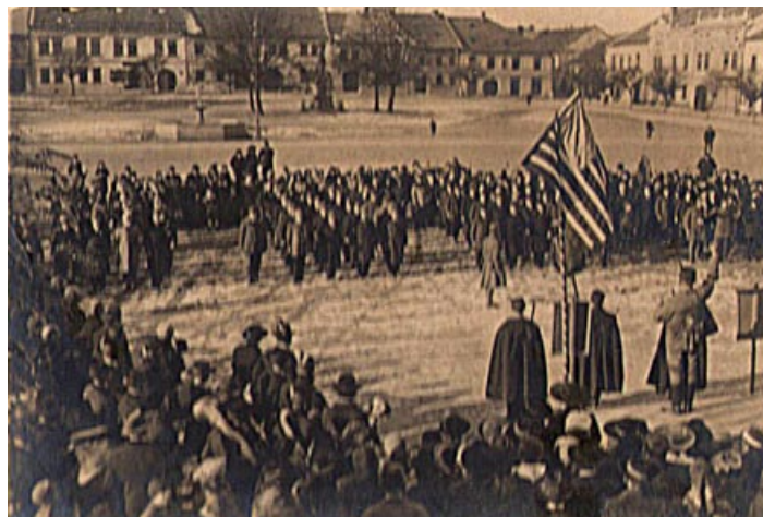
Vznik samostatné republiky v roce 1918