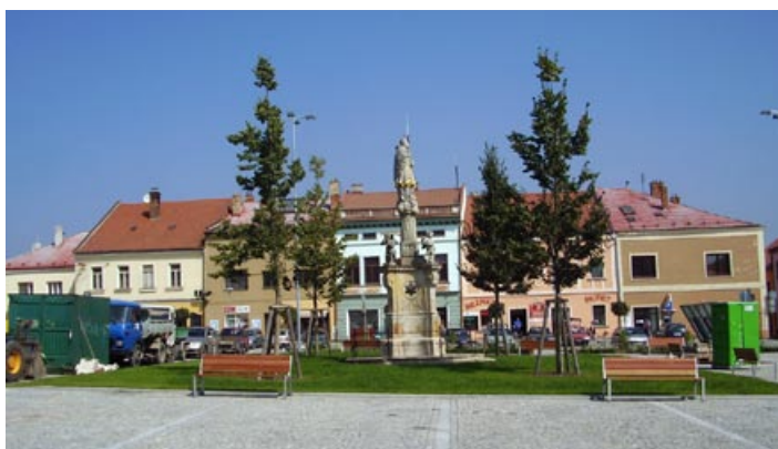
Náměstí s mobiliářem