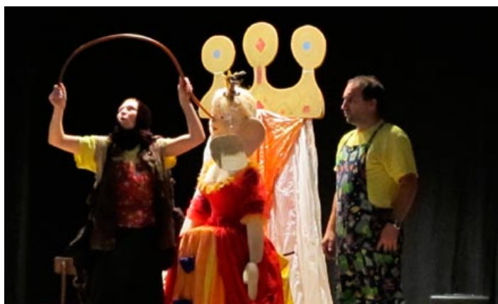
Divadelní představení pro děti