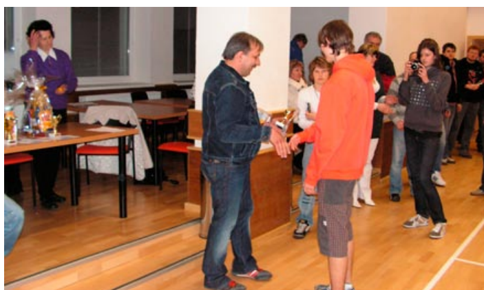
Turnaj ve stolním tenise