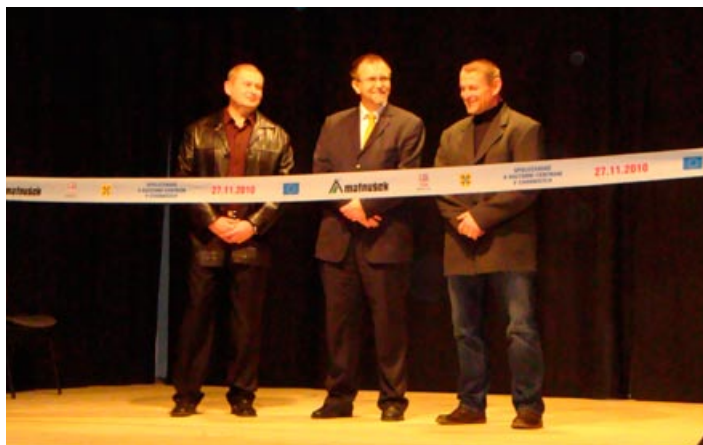
Slavnostní otevření KD