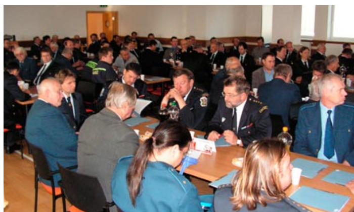
Okresní sněm dobrovolných hasičů