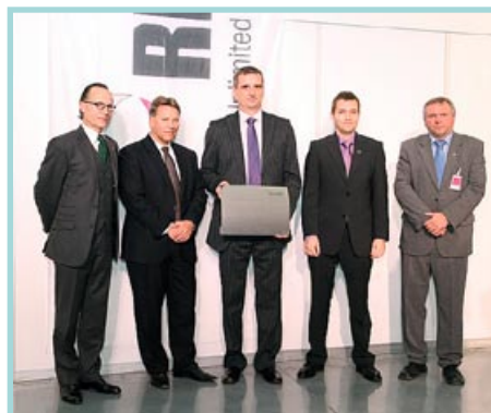
Slavnostní otevření firmy REHAU