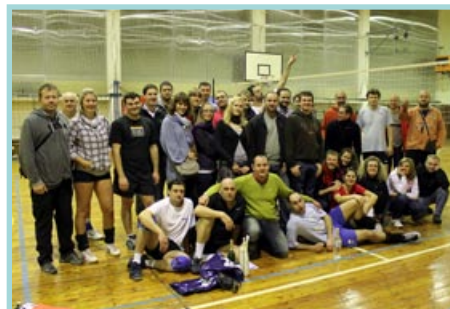
Jevíčko Srstka Open 2011