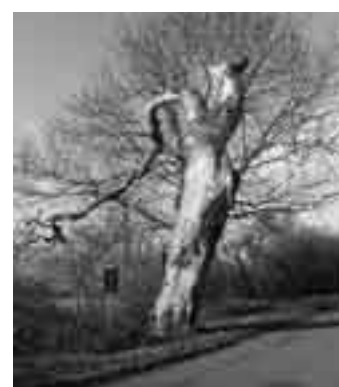
Borovice u Biskupic