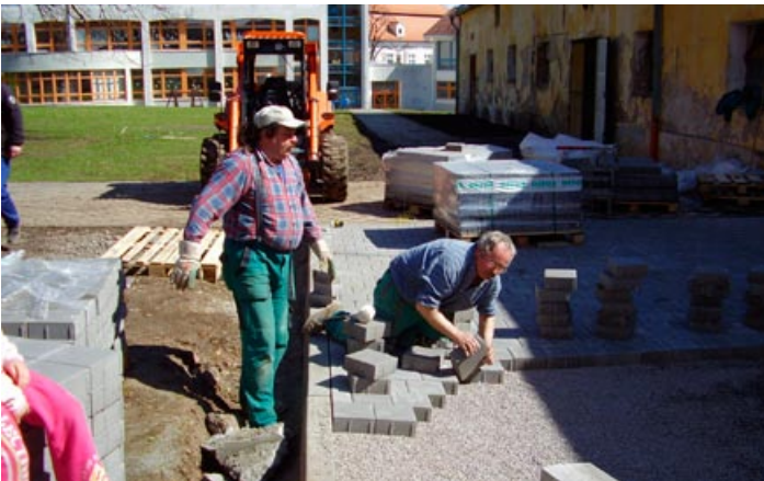
Nová dlažba ve dvoře „Inceminačky“