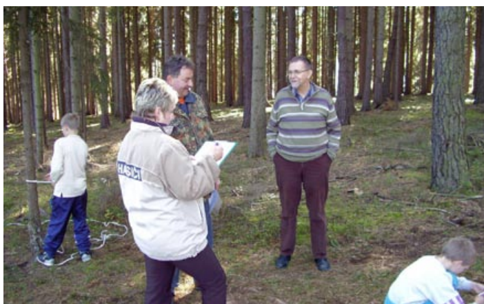
Na branném závodě ve Smolenském údolí