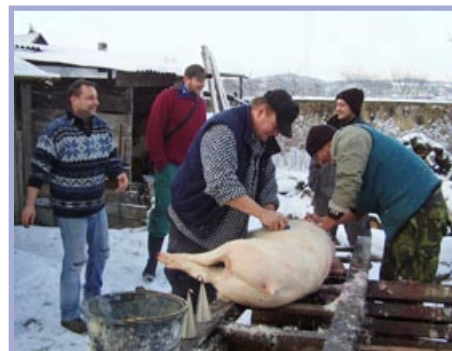
Čas Vánoc a zabíjaček