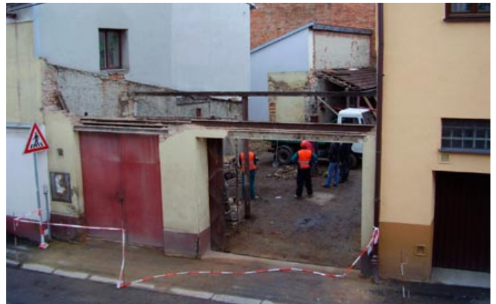
Začaly demoliční práce ve dvoře úřadu