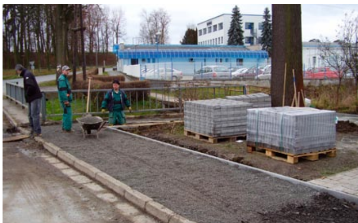
Nový chodník u Penny marketu