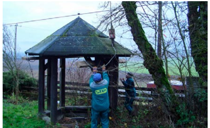
Stěhování střechy rumpálu