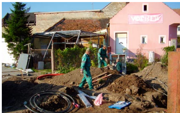
Přeložka elektrického vedení Pod Zahradami