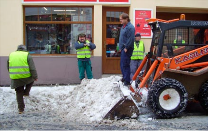
Sněhová nadílka zavalila město