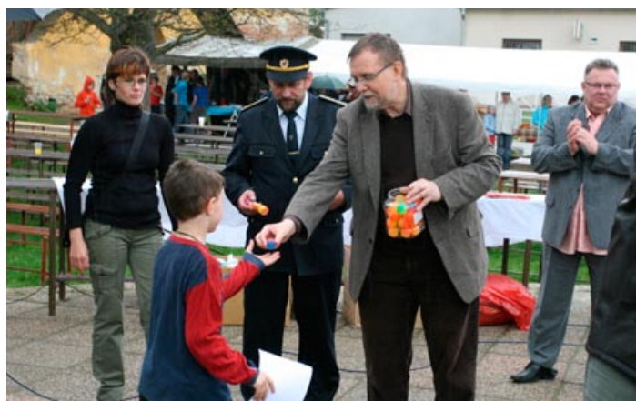
Na hasičských závodech