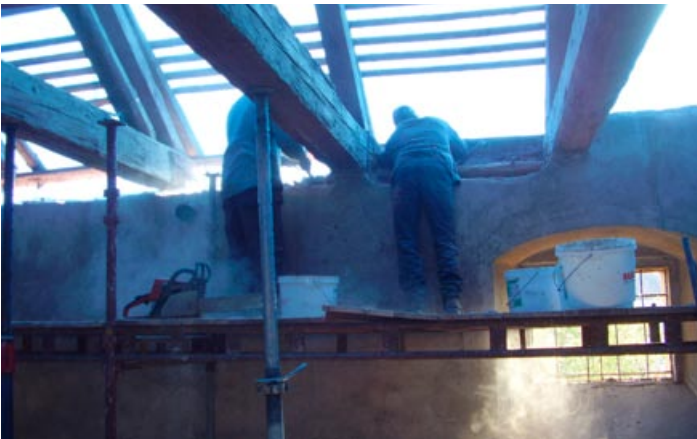
Bourání římsy na sýpce