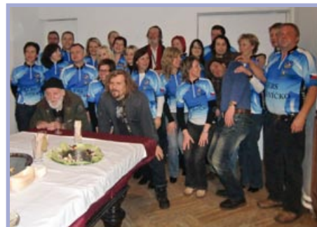
Město reprezentovalo v divadle Bolka Polívky