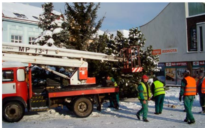
Postavení vánočního stromu