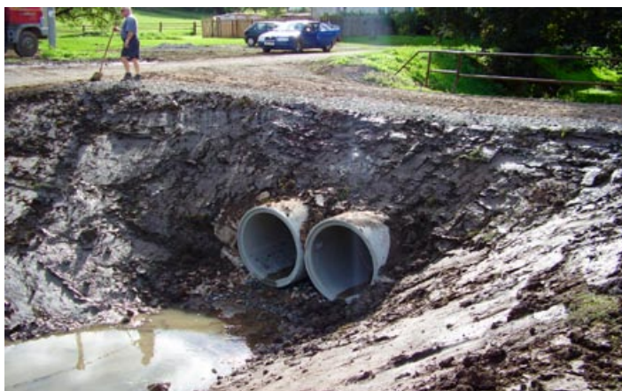
Opravený propustek v Zadním Arnoštvě