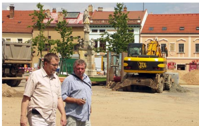
Při kontrole revitalizace Palackého náměstí