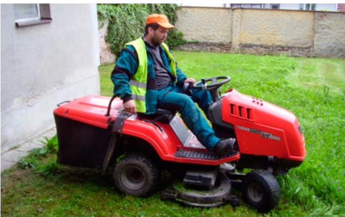
Pokračovalo sečení veřejné zeleně