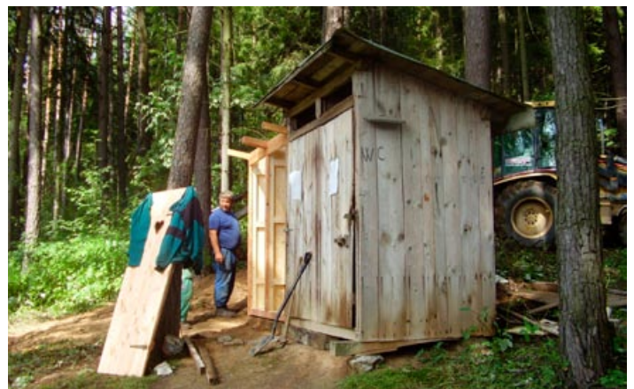
Instalovali jsme nové WC na „Pionýrské chatě“