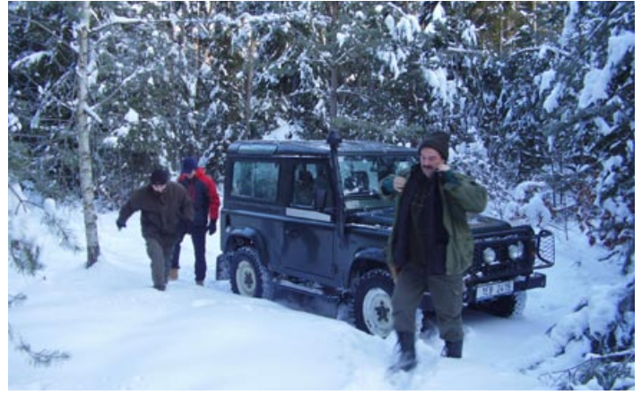
Zimní kontrola lesa