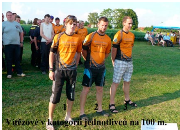
Vítězové v kategorii jednotlivců na 100 m.