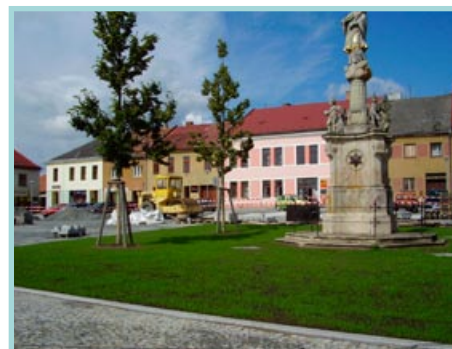
Nový trávník na Palackého náměstí