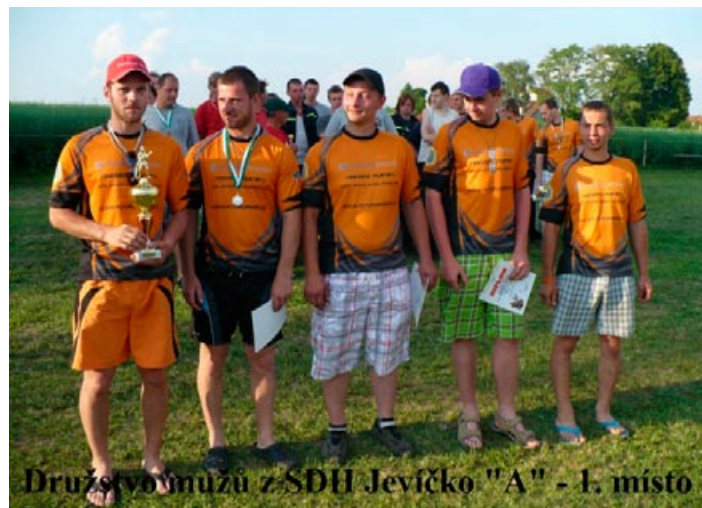
Družstvo mužů z SDH Jevíčko "A" - 1. místo