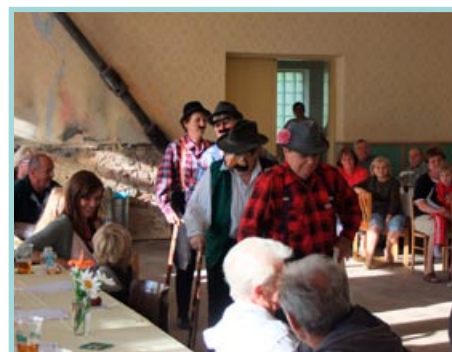
Setkání v Zadním Arnoštově zpestřil jaroměřický Věchétek