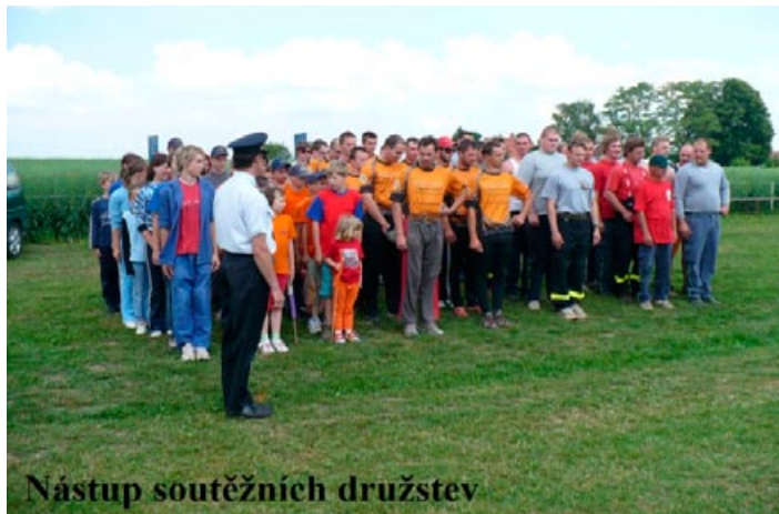
Nástup soutěžních družstev