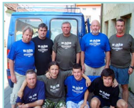
Stavěcí četa míří do Bobrovecké doliny