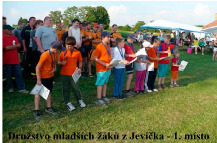
Družstvo mladších žáků z Jevíčka - 1. místo