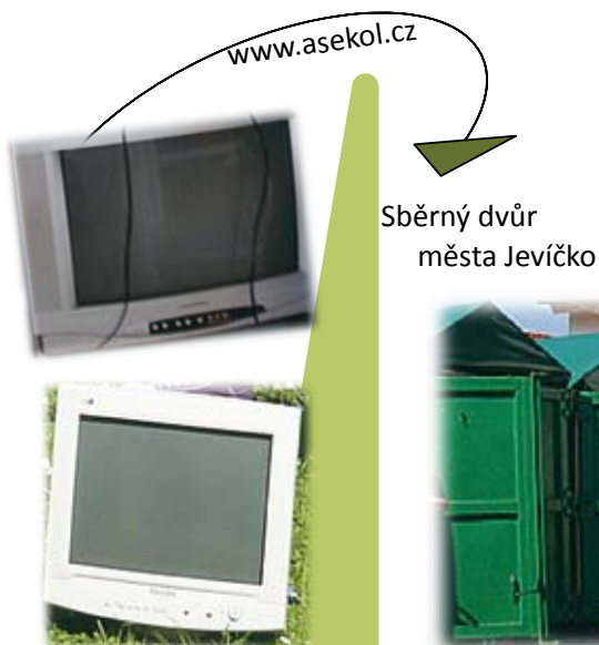
Sběrný dvůr města Jevíčko