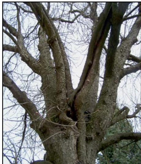
Poškození kosterních větví dřeviny