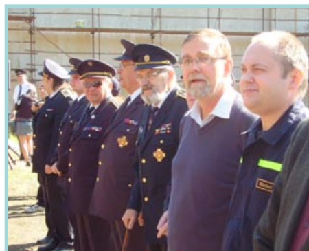
Pohár Malé Hané ve Velkých Opatovicích