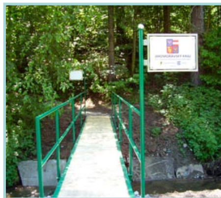
Nová lávka za Smolenskou přehradou